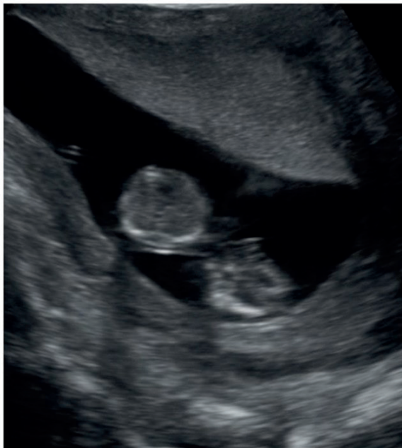
FIGURA 1. EN LA FOTO DE LA IZQUIERDA SE OBSERVAN AMBOS GEMELOS, SIENDO EL ACÁRDICO EL QUE SE UBICA EN LA PARTE INFERIOR. EN LA FOTO DE LA DERECHA SE OBSERVA LA VASCULARIZACIÓN A NIVEL DEL INGRESO DEL CORDÓN UMBILICAL DEL GEMELO ACÁRDICO A LAS 16 SEMANAS.

La paciente pasó a sala de recuperación y luego de 2 horas a su habitación, donde el personal de