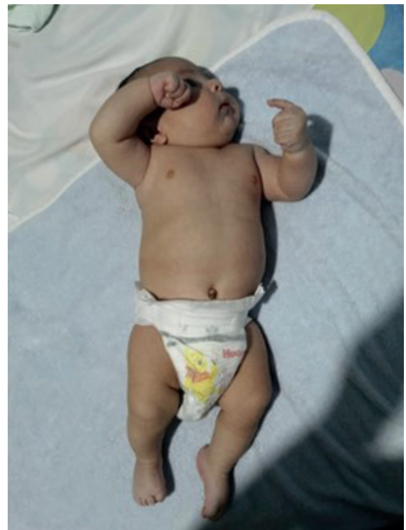
FIGURA 4. GEMELO SOBREVIVIENTE AL TERCER MES DE VIDA.

Dentro de las opciones terapéuticas, actualmente se prefiere el uso de técnicas por ablación intrafetal, entre las que resaltan la ablación por